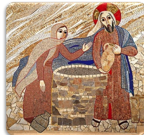
“Se tu conoscessi il dono di Dio...” (Gv 4,10) Gesù con la Samaritana - M. Rupnik

SPAZIO DI INCONTRO NELLA FEDE, RIVOLTO A PERSONE SEPARATE, DIVORZiate O CHE VIVONO NUOVE UNIONI