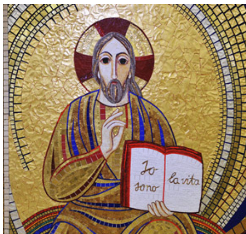
Cristo in gloria - M. Rupnik

(Card. Angelo Scola - Avvenire 28.05.2012)